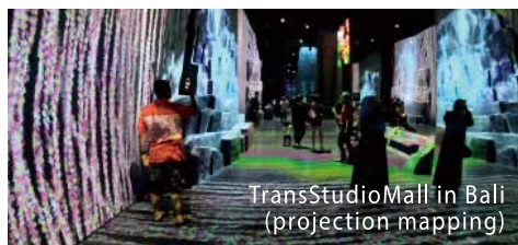
TransStudioMall in Bali (projection mapping)

インドネシア、バリ島のショッピングモールに作られた、バリの 魅力を体験・体感してもらうための巨大なエンタテインメント。 『五感』をテーマとした5つのゾーンが、バリに息づく文化や風景 の鼓動を、訪れた人々に訴えかけます。